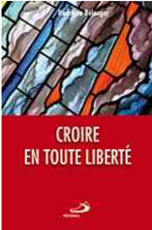
BÉLANGER, Rodrigue, CROIRE EN TOUTE LIBERTÉ Montréal: Mediaspaul, 2009